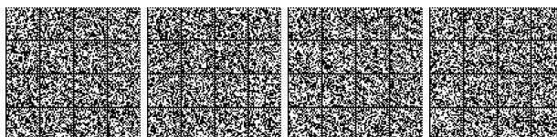
Tabella 0: Misure gestionali per il livello di prestazione 0